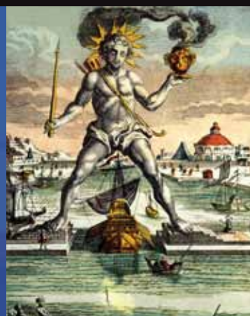
Koloss von Rhodos, Kupferstich