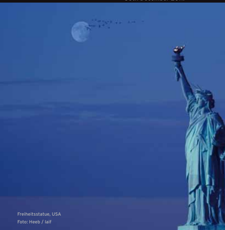
Freiheitsstatue, USA

Seven Wonders of the World were known in Classical Antiquity, but today the UNESCO has counted more than 900 World Heritage Sites which are masterpieces of human architecture and huge monuments of nature. For the first time in an exhibition, "Magic Places" is showing the wonders of nature and culture together - as equally significant creations of our planet. "Magic Places" leads us to the unique monuments in which the history of our Earth comes to life in all its wonderful variety. "Magic Places", that is our World Heritage in its wondrous diversity to which the yearning and the joy of discovery of every generation is repeatedly orientated anew.