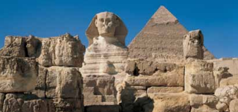
Sphinx und Chephren-Pyramide, Ägypten

Der Gasometer Oberhausen zeigt in Kooperation mit der Deutschen UNESCO-Kommission und der TUI Deutschland vom 8. April bis 30. Dezember 2011 die Ausstellung „Magische Orte - Natur- und Kulturmonumente der Welt“. The Gasometer in Oberhausen will be showing, in cooperation with the German Commission for UNESCO and TUI Germany, the exhibition "Magic Places - Natural and Cultural Monuments of the World" from 8th April until 30th December 2011.