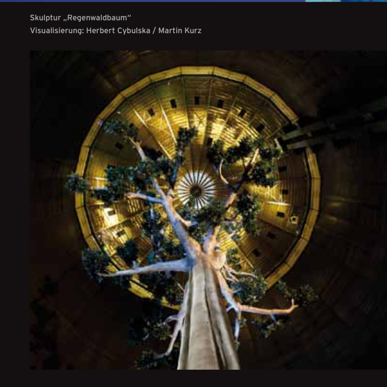
Skulptur „Regenwaldbaum“ Visualisierung: Herbert Cybulski / Martin Kurz